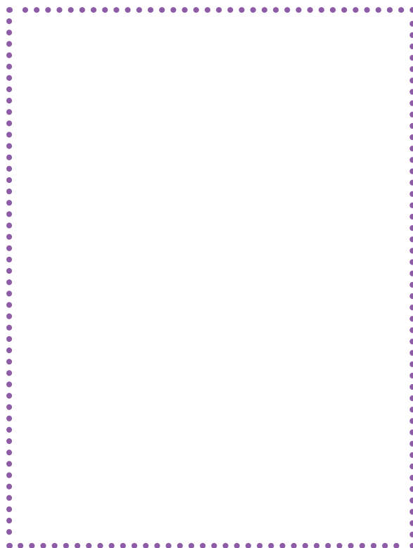
FLASCÓ DE LA REINA

2 Relaciona cada frase amb una comparació.